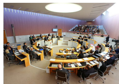
Der Landtag Vorarlberg wird neu gewählt!