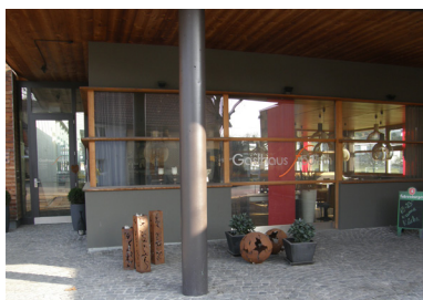
Gasthaus Frödisch in Muntlix

Seit nun genau einem Jahr ist das Gasthaus Frödisch in Muntlix in neuer Pächterhand und erfreut sich großer Beliebtheit. Vom sonntäglichen Stammtisch, der Jasserrunde bis zur Ballveranstaltung und Geburtstagsfeiern wird von unserer fleißigen Pächterin und ihrem Team alles abgedeckt. Die gesamte Speisekarte kann auch telefonisch bestellt, abgeholt oder zugestellt werden. Unterstützen Sie unser Dorfgasthaus und machen Sie Ihre Geburtstagsfeier oder Ihre Weihnachtsfeier in den Räumlichkeiten des Gasthauses Frödisch in Muntlix.