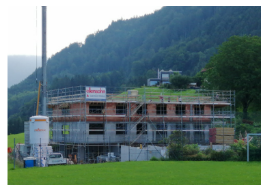
Wohnbau Dafins - Rohbau September 2019