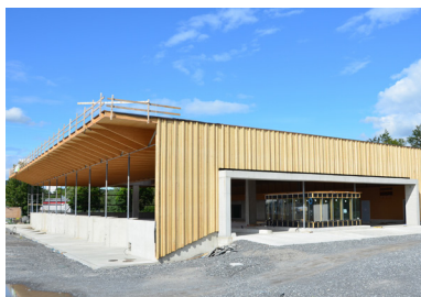
Außenfassade ASZ Vorderland