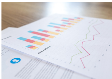
Positiver Rechnungsabschluss 2018

Der Rechnungsabschluss 2018 wurde vor kurzem von der Gemeindevertretung beschlossen und freigegeben. Durch diverse Minder- und positiverweise auch Mehreinnahmen konnte die Haushaltsrücklage auf 773.995,- Euro erhöht werden. Der Schuldenstand der Gemeinde konnte um 452.759,- Euro reduziert werden. Das neue Darlehen in der Höhe von 654.000,- Euro für die Furxstraßensanierung erhöhte den Gesamtschuldenstand auf 6,8 Mio. Euro. Damit ergibt sich eine Pro-Kopf-Verschuldung von 2.098 Euro, das entspricht fast dem Landesdurchschnitt von 1.900 Euro pro Einwohner, trotz unserer schwierigen topographischen Lage und drei Ortsteilen mit der nötigen Infrastruktur. Die „frei verfügbaren Mittel“ sind eine sehr wichtige Finanzkennzahl und konnte auf 880.300,- Euro erhöht werden. Es konnte sogar ein Maastrichtüberschuss in der Höhe von 267.600 Euro erwirtschaftet werden.