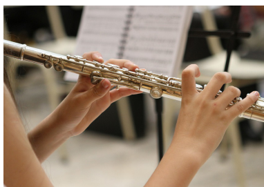
Das Musikschulkontingent wurde erhöht

Bei der letzten Gemeindevertretungssitzung wurde das bestehende und budgetierte Wochenstundenkontingent für die Musikschule Rankweil-Vorderland von max. 65 auf die nun nötigen Stunden von ca. 75 Std erhöht. Damit können nun unsere 138 musikbegabten Kinder auch im Schuljahr 2019/2020 beim Musikschulunterricht teilnehmen. Die Kosten werden zu 36% vom Land, zu 37% von unserer Gemeinde und die restlichen 27% von den Eltern übernommen. Es freut mich ganz besonders, dass nun alle Kinder die Musikschule besuchen können.